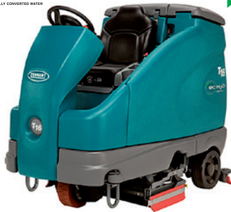
T16 - Batteridrivnen åkbar industri-kombiskurmaskin/skursopmaskin med 90 cm arbetsbredd. Kan utrustas med sidoskurpaket med högt skurtryck. Passar för ytor upp till 20000 m 2 .