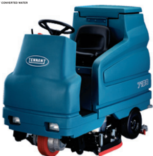
7100 - Batteridrivnen åkbar industri-kombiskurmaskin/skursopmaskin med 70-80 cm arbetsbredd. Passar för ytor upp till 10000 m 2 .