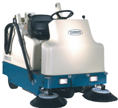
6200 - Högtömmande industrisopmaskin med 107-140 cm arbetsbredd. Sidosopborste som standard. Passar till ytor upp till 16000 m 2 .