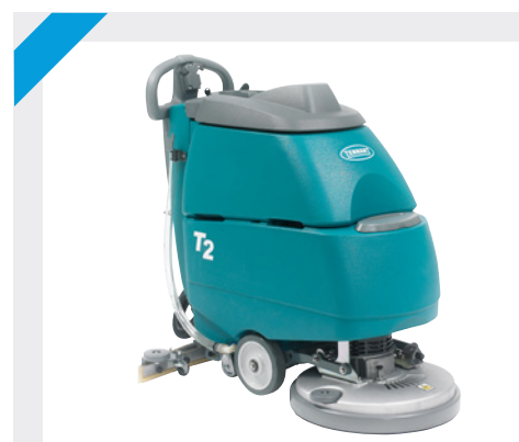
T2 - Batteridrivna kombiskurmaskin med 42 cm skurbredd. Passar för medelstora ytor.

Lägger ut rengöringslösning på golvet, skurar och sopar golvet i ett moment. Smutsvattnet hamnar i maskinens smutsvattentank.