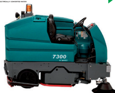
7300 - Batteridrivnen åkbar industri-kombiskurmaskin/skursopmaskin med 102 cm arbetsbredd. Sidosopborste som tillval. Passar för ytor upp till 30000 m 2 .