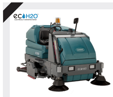
8300 - Batteridrivna åkbara sopsugskurmaskin med 100-120 cm arbetsbredd. Sidopborste som standard. Passar för ytor upp till 50000 m 2 .

Lägger ut rengöringslösning på golvet, skurar och sopar golvet i ett moment och suger sedan upp smutsvattnet i maskinens smutsvattentank. Sopor och skräp samlas i maskinens sopbehållare.