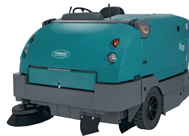
S30 - Diesel / LPG driven åkbar högtömmande industri-sopmaskin. Sidosopborste och 3-stegsfiltersystem som standard. 160-210 cm arbetsbredd. Passar till de riktigt stora ytorna.