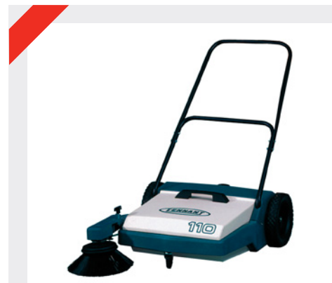
110 - Manuell sopmaskin för inomhus- och utomhusbruk.

Sopar upp torrt skräp sopor och damm, ett filter-system reglerar dammbildningen.