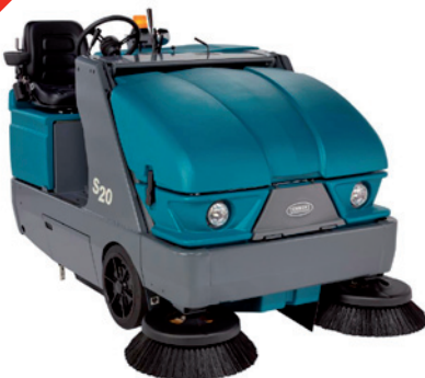
S20 - Högtömmande industrisopmaskin med 3-stegsfiltersystem, 1 Sidosopborste som standard. 127-157 cm arbetsbredd. Passar till ytor upp till 40000 m 2 .