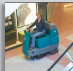
Maskinen i drift