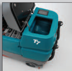
Tankar som lätt kan rengöras