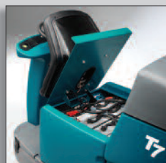
Batteripaket som räcker länge