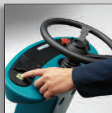
Rengöring med en knapptryckning