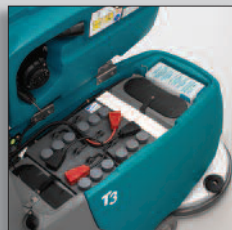
Batteripaket som räcker länge