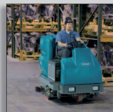
Maskinen i drift