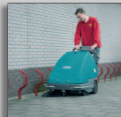
Lättkörd och smidig