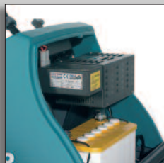
Batteripaket med inbyggd batteriladdare