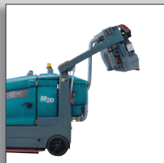
Variabel hög tömning