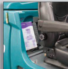
Integrerat 4L FaST-PAK