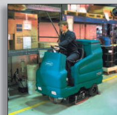
Maskinen i drift