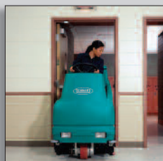
Skurar genom 90cm dörröppningar