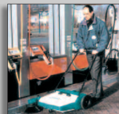
Maskinen i drift