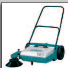
Sidoborsten kan höjas