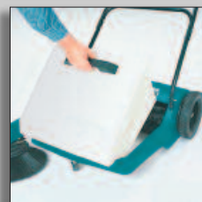
Sopbehållare som är lätt kan tömma